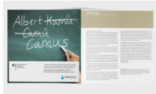
Grußwort & Anzeige im Programmheft