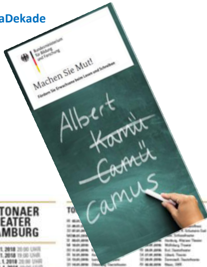
Flyer der AlphaDekade